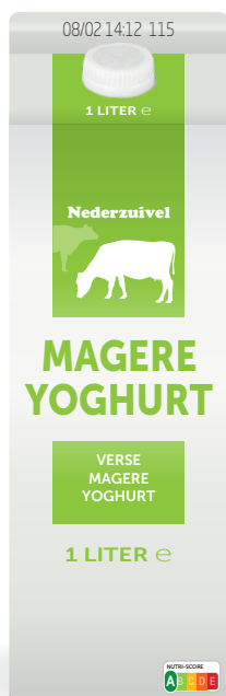
Voorbeeld van het Franse Nutri-Score

Het is belangrijk de consequenties van deze keuzes mee te nemen in de besluitvorming.