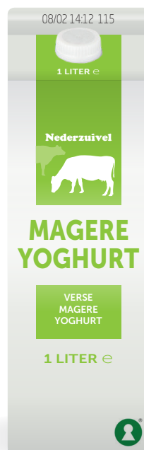
Voorbeeld van het Scandinavische Keyhole